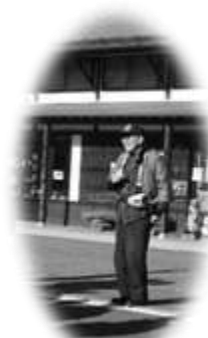
専門ガイドの 解説付!